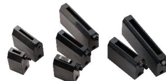
※タイプホルダ各種サイズあり