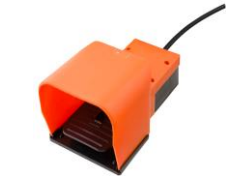
※標準付属のフットスイッチ