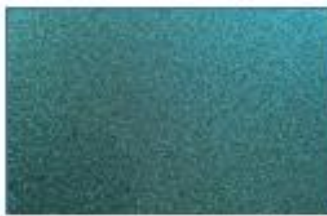
エメラルドグリーン(214)