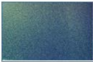
ピーコックブルー(207)