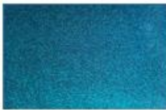
ターコイズブルー(215)