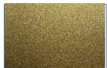
ヴェールゴールド(212)