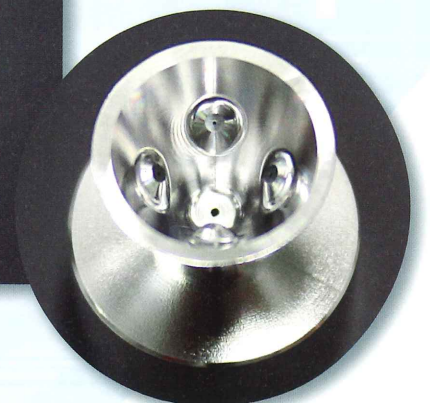
人工衛星燃料噴射ノズル 細穴Φ0.2mm×L2.0mm傾き45度