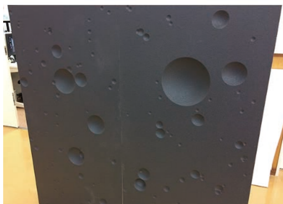
小惑星の地形モデル